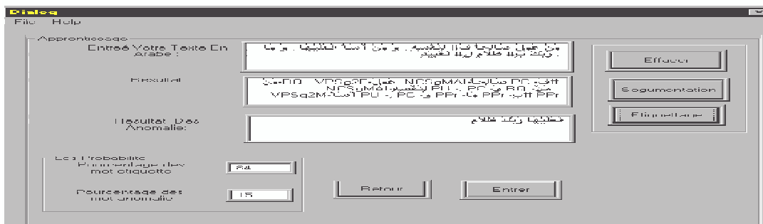
Figure 2. Résultats à base de règles

Tout ces cas sont prisent par le système proposé et globalement les résultats attestent du gain apporté par le MBL, la figure 2 présente un pourcentage des cas anomalies, qui semble témoigner des limites de la base de règles(15% cas anomalies). Les résultats obtenus par la combinaison de base de règles et le MBL(figure 3) sont nettement supérieurs aux résultats obtenus par la méthode à base de règles. En particulier pour les cas de nom et de nom adjectif qui montrent que les exceptions des règles sont prises en charge par la méthode MBL. La remarque qu'on peut émettre, suite aux résultats obtenus, c'est que pour la langue arabe les informations lexicales jouent un rôle primordial dans la détermination du tag du mot en question.